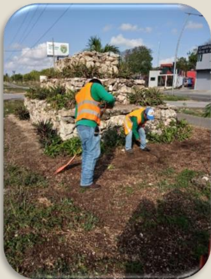
Se limpia pirámide del exterior, lado Huayacan.