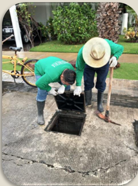
Se realiza limpieza de registros.