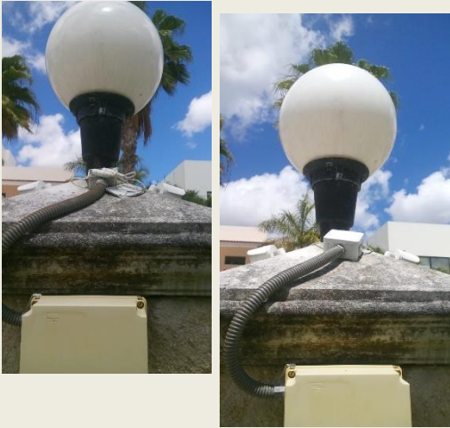
Se cambió Caja de Registro 4x4 deteriorada por una Caja de Registro 5x5 en Santander